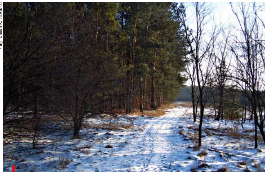
Zimowy las we wsi Klarów (gmina Milejów)