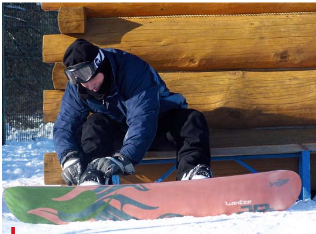
Snowboard, to jest to!