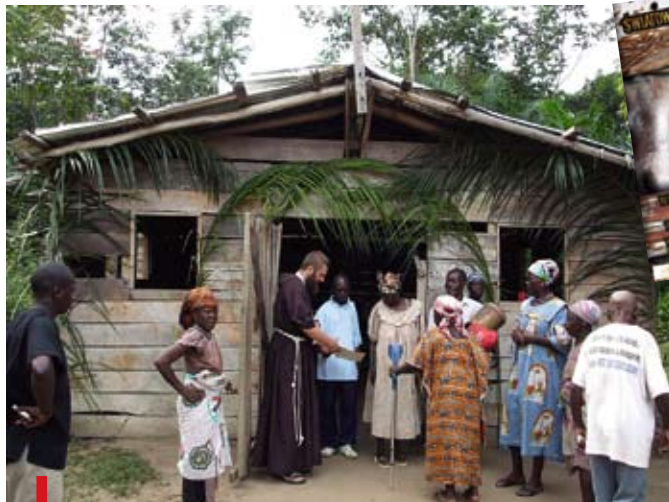
Kapucyni pracują w Gabonie od 2000 r. Teraz w tym miejscu chcą zbudować szpital (NA DOLE Z LEWEJ)

Gabon jest krajem równinowym sąsiadującym z Kongiem, Kamerunem i Gwineą Równinową. Strefa klimatyczna sprzyja