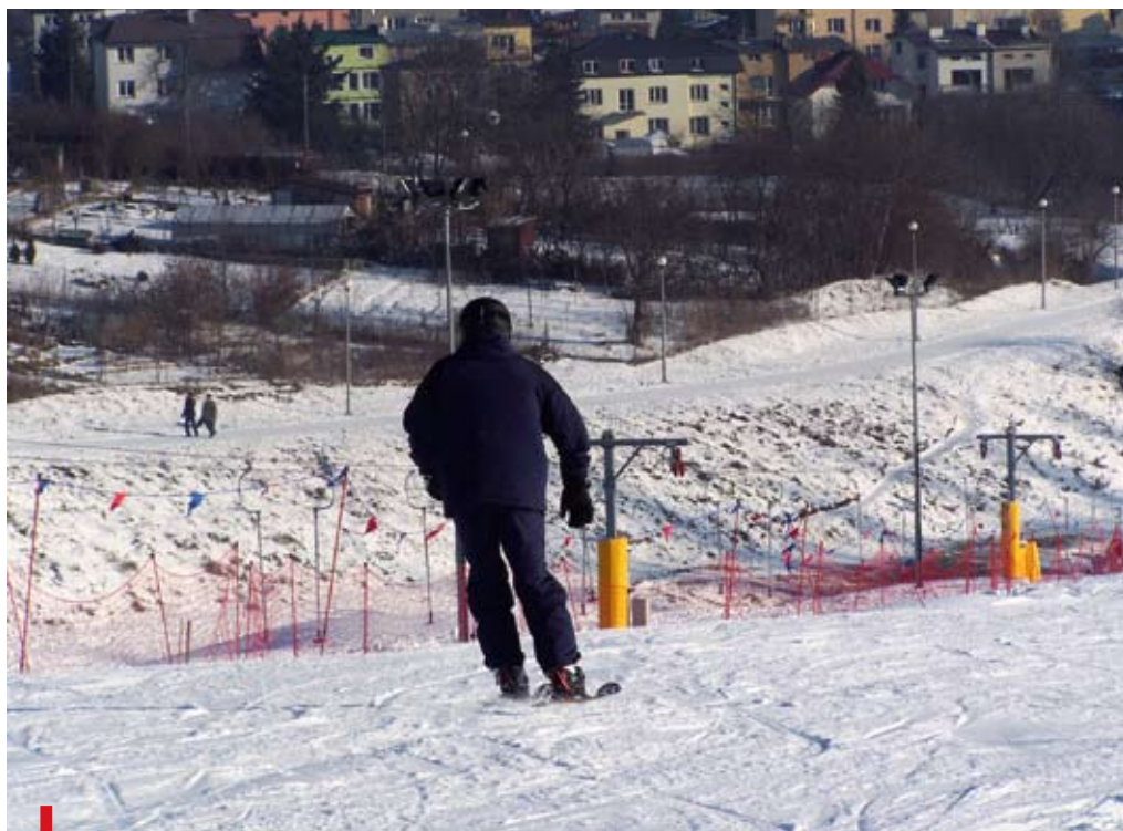
Ferie najlepiej spędzić na stoku