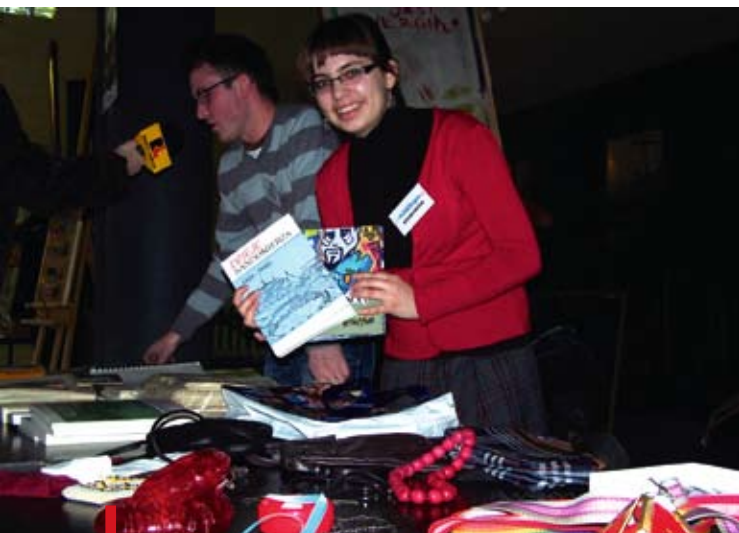
Na pchlellegro można było wymienić się wszystkim na wszystko