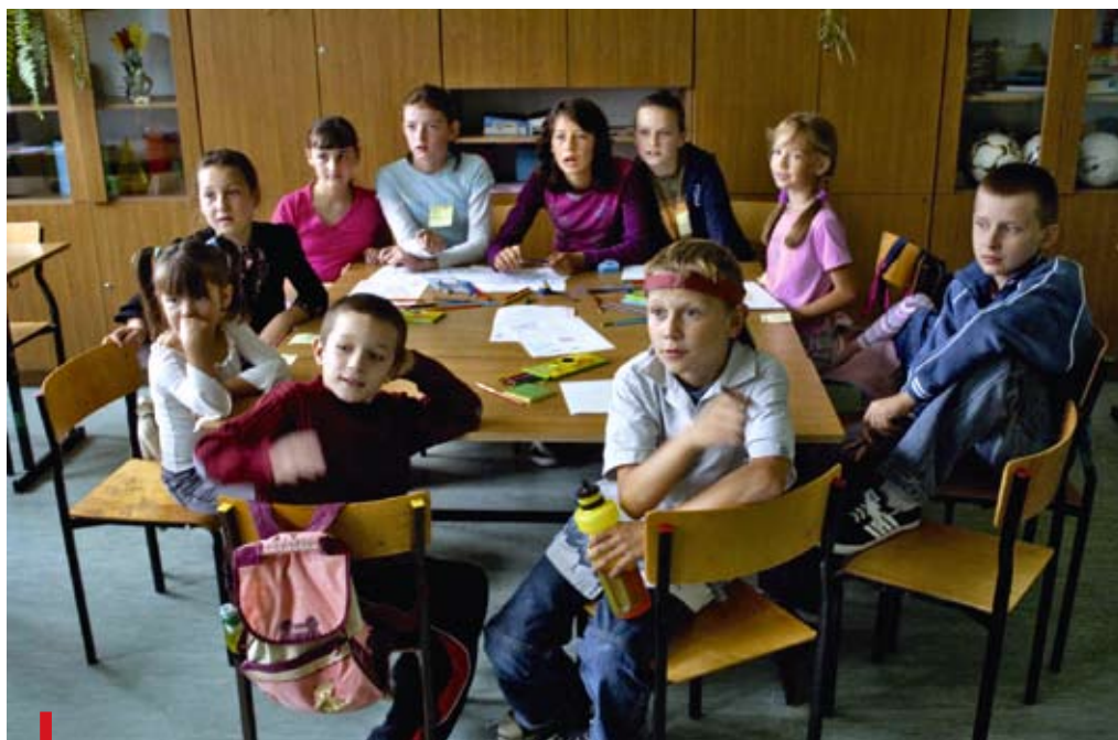
Dzieci, które nie wyjadą na ferie, mogą spędzić czas na półkoloniach PONIŻEJ: W zimowe wakacje trzeba odwiedzić lodowisko

Funkcjonariusze lubelskiej policji przeprowadzili w szkołach dziesiątki wykładów, których celem było przybliżenie zagrożeń, jakie czyhają na wypoczywających uczniach. Policjanci, wspomaganymi przez inspektorów nadzoru drogowego, będą również czuwać nad odpowiednim stanem technicznym, a także nad trzeźwością i stanem psychofizycznym