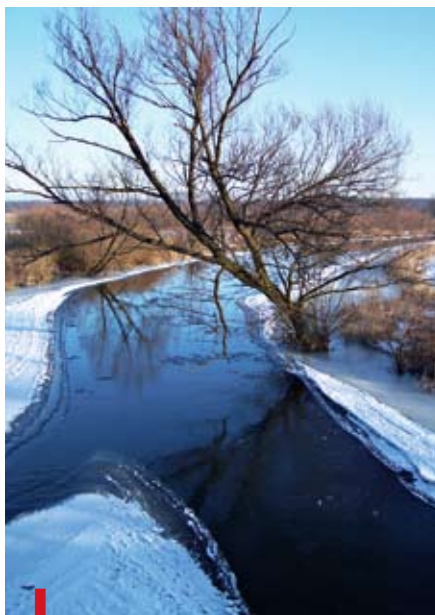
Przeptywający przez powiat łęczyński Wieprz jest w ziemie skutu lodem

www.leczna.pl lub pod nr. tel. 081 462 75 05. Na zwycięzców czekają wspaniałe nagrody-niespodzianki. Termin nadsyłania fotografii upływa 28 lutego 2009 r. Wręczenie nagród zwycięzcom nastąpi podczas wernisażu pokonkursowego 25 marca 2009 r. o godzinie 17.00 w siedzibie MGBP. Organizatorem konkursu jest Młodzieżowa Rada Miejska w Łęcznej przy współpracy Miejsko-Gminnej Biblioteki Publicznej – Filia nr 3 w Łęcznej i Rady Osiedla Bobrowniki. kt