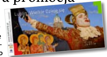
KANCELARIA PREZYDENTA - MARKETING MIASTA LUBLIN

Lublin – Wielkie Dzieje się, Lublin – Nieziemski klimat czy Bądź wolny, studiuj w Lublinie to tylko niektóre akcje promocyjne stolicy regionu. Biuro Marketingu Urzędu Miasta podsumowało swoje działania.