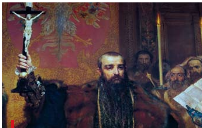
Król Zygmunt II August 1 lipca 1569 r. doprowadził do scalenia Korony i Wielkiego Księstwa Litewskiego

Polskich przykładów jest 7: autograf dzieła Mikołaja Kopernika „De revolutionibus orbium coelestium” przechowywany w Bibliotece Jagiellońskiej w Krakowie, akt Konfederacji Generalnej Warszawskiej z 1573 roku, rękopisy Fryderyka Chopina w zbiorach Biblioteki Narodowej i Towarzystwa im. Fryderyka Chopina w Warszawie, podziemne archiwum getta warszawskiego (tzw. Archiwum Ringelbluma), tablice 21 postulatów gdańskich z Sierpnia 1980, Kodeks supraski w zbiorach Biblioteki Narodowej w Warszawie oraz Archiwum