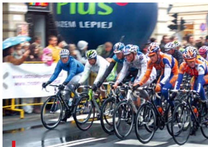
W tym roku pogoda musi dopisać. Kolarze nie będą strajkować

Jeśli chodzi o majowe zawody w kolarstwie górskim, to do Nałęczowa zjadą największe sławy tego sportu. Seria wyścigów