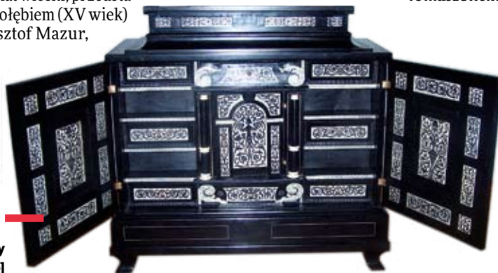
Sepet – rozkładany przenośny mebel

Interesujące są umbrakulum (rodzaj parawanu stosowanego przed Soborem Watykańskim II do przysyłania