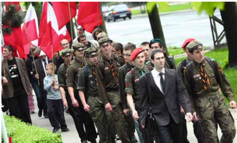
■ LUBLIN. 13 maja ulicami miasta przeszedł Marsz Rotmistrza Pileckiego

W 109. rocznicę urodzin śp. Witolda Pileckiego w siedmiu największych polskich miastach (w tym w Lublinie) przeszły Marsze Rotmistrza. Pochód poprzedziła Msza święta, która odbyła się w kościele garnizonowym. Stamtąd manifestujący przeszli pod ratusz, gdzie znajduje się wystawa poświęcona „Ochotnikowi do Auschwitz”, wielkiemu polskiemu patriocie, na którym 25 maja 1948 wyrok śmierci wykonali funkcjonariusze UB.