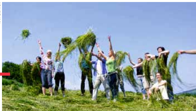
KSM co roku zapewnia ciekawie spędzone wakacje

Zapisy w Centrum Duszpasterstwa Młodzieży w Lublinie, ul. Krakowskie Przedmieście 1, tel. 81 532 13 95. Więcej na www.ksm.lublin.pl . Alicja Nowak