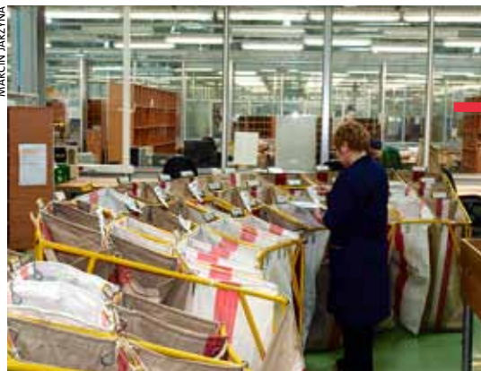
Węzeł ekspedycyjno-rozdzielczy Poczty Polskiej ma obsługiwać przesyłki z całej wschodniej Polski

LUBLIN. Ruszyła działalność jednego z ośmiu, a zarazem jednego z największych węzłów pocztowych w Polsce. Powstał kompleks Poczty Polskiej, tzw. węzeł ekspedycyjno-rozdzielczy, jest jedynym takim centrum logistycznym we wschodniej Polsce. Wartość inwestycji sięgnęła 120 mln zł. W nowym kompleksie ma pracować około 700 osób. Nowa sortownia przyspieszy obsługę klientów, unowocześni pracę oraz poprawi warunki socjalne pracowników.