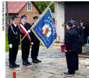
Strażacy OSP w Czerniejowie ze swoim nowym sztandarem