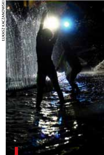
Noc Kultury to klimat, taniec barw z muzyką, przenikanie sztuki