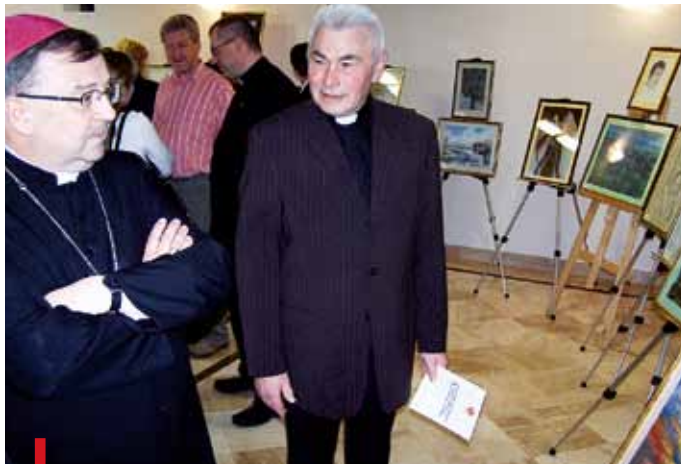
Poziom artystyczny prac młodych ludzi pochwalił abp Józef Życiński

Blisko 900 prac wpłynęło na konkurs „Talent”, zorganizowany przez Caritas Archidiecezji Lubelskiej. Teraz najlepsze z nich mają być zlicytowane, a dochód z ich sprzedaży zasili stypendialny program „Skrzydła”.