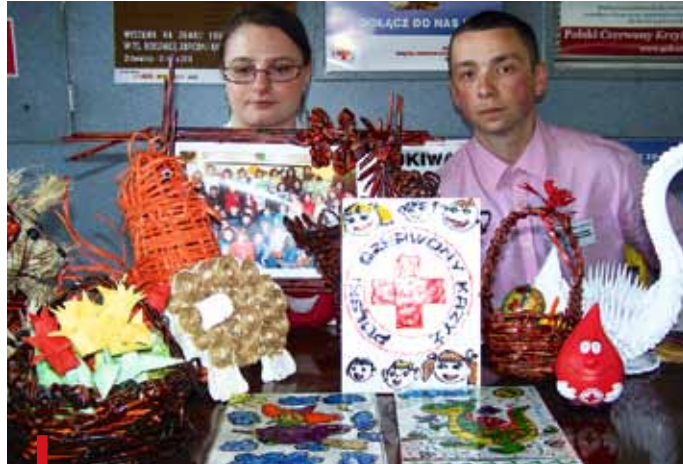
Wolontariusze i rękodzieło wykonane przez dzieci ze świetlicy prowadzonej przez PCK

Co powoduje społeczne wykluczenie i co robić, by zwalczać negatywne skutki odtrącenia? Czym jest ubóstwo i gdzie go najwięcej? Tego typu zagadnienia były omawiane na dwóch toczących się niedawno konferencjach.